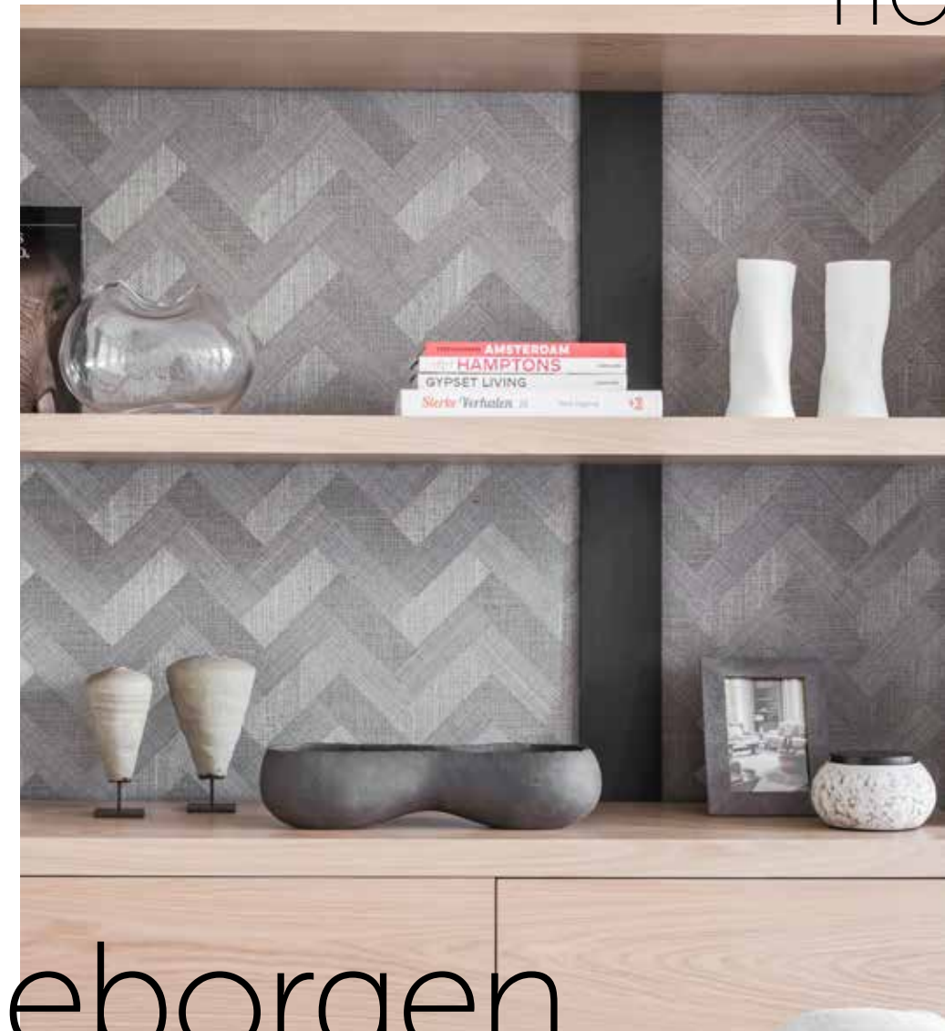
Behang van Arte. Accessoires via Wolterinck.