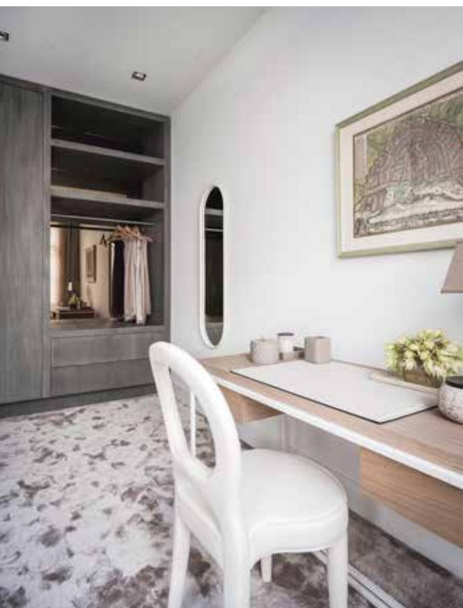
Multifunctioneel meubel met spiegel en kledingrek van het label Frag.