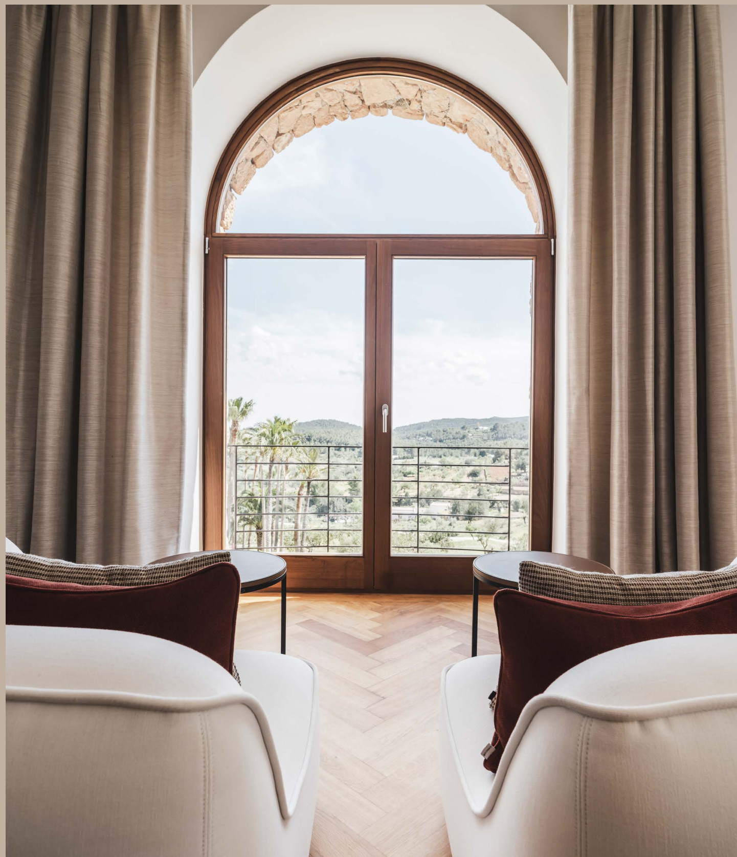
Designing Your World II van topontwerper Marcel Wolterinck toont zeventien nieuwe high-end projecten in binnen- en buitenland. De projecten in dit tweede boek zijn allemaal recent opgeleverd en vormen een prachtige afspiegeling van hoe er op dit moment in het hoogste segment van de markt wordt gewoond, gewerkt en geleefd. Of het nu op een klassiek landgoed op de Utrechtse Heuvelrug is, in een frisse loft in de Amsterdamse Jordaan of in een kleurrijk vakantiehuis op Ibiza: geen twee projecten zijn gelijk en toch zijn ze door hun hoogwaardige afwerking en verfijnde stijl stuk voor stuk onmiskenbaar Wolterinck. wolterinck.com